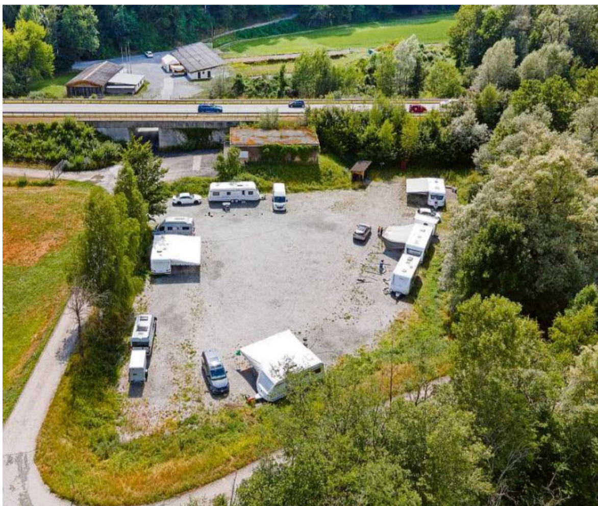
Ein Leben auf Reisen: Der Durchgangsort für Schweizer Fahrende in Bonaduz.

«Ich bin zufrieden, dass bei der Bewertung zumindest ein Genügend herausgekommen ist», sagt