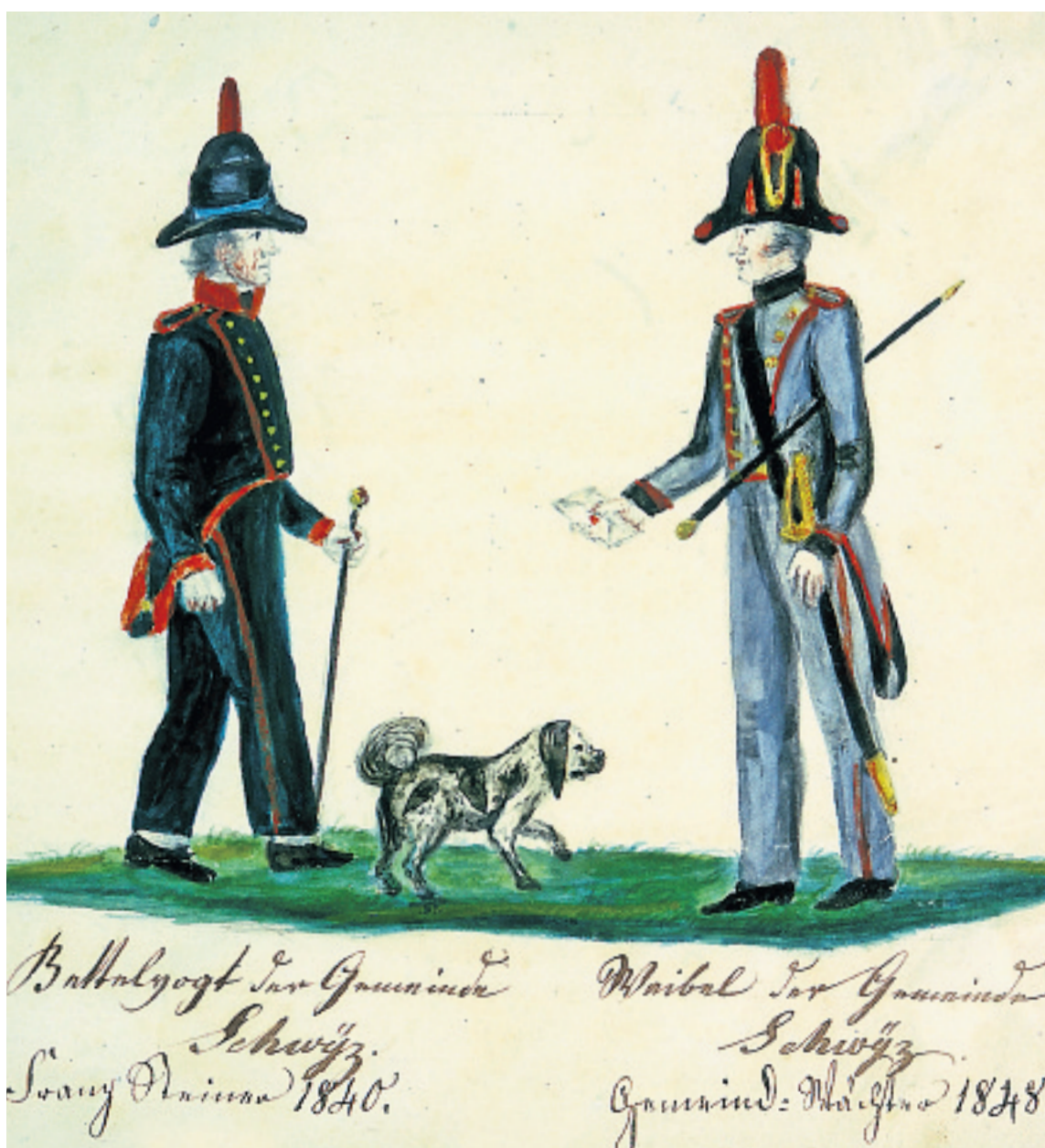
Eine der Hauptaufgaben des Bettelvogts war es, unerwünschte Fremde über die Kantonsgrenze zu schaffen. Nach 1803 übernahmen die Landjäger diese Aufgabe.